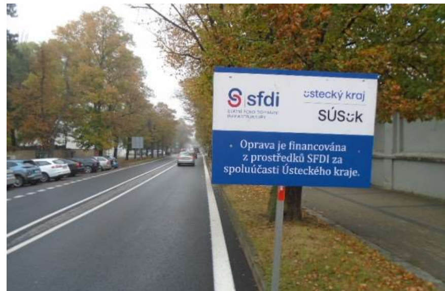
25. II/225 Žatec - průtah (Komenského alej)