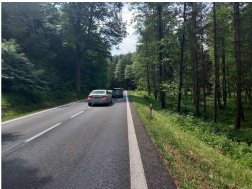
1. II/263 Chřibská – protismyková úprava