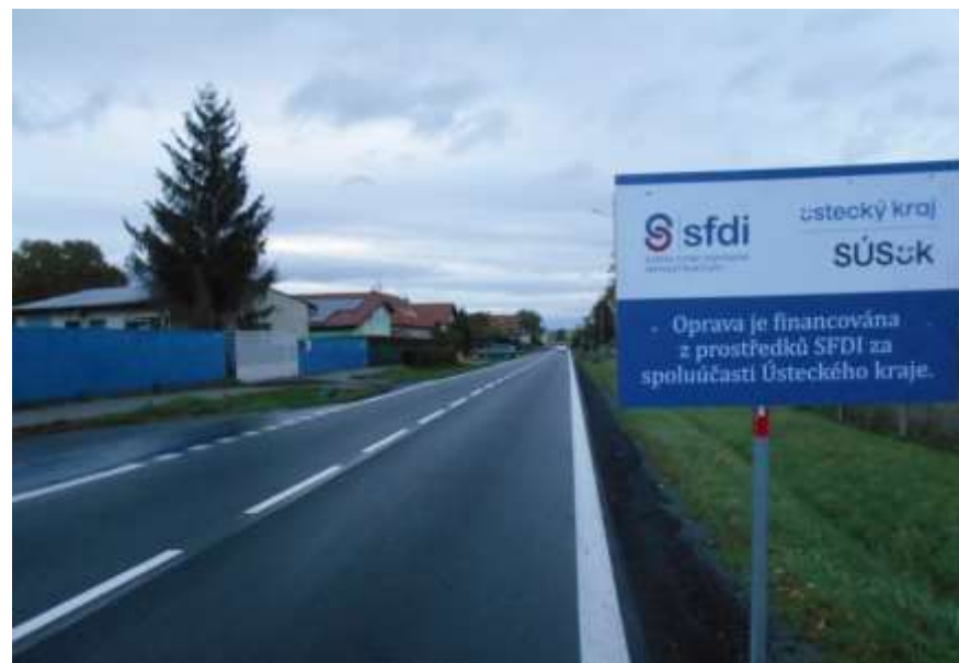
24. II/221 Podbořany průtah (ul. Vroutecká)