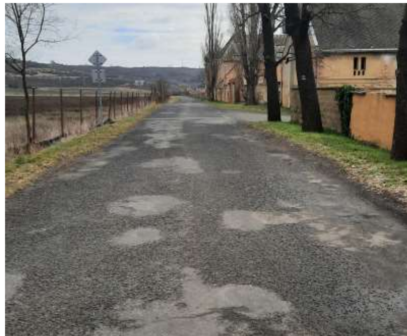
12. III/22514 Vičice - Stranná