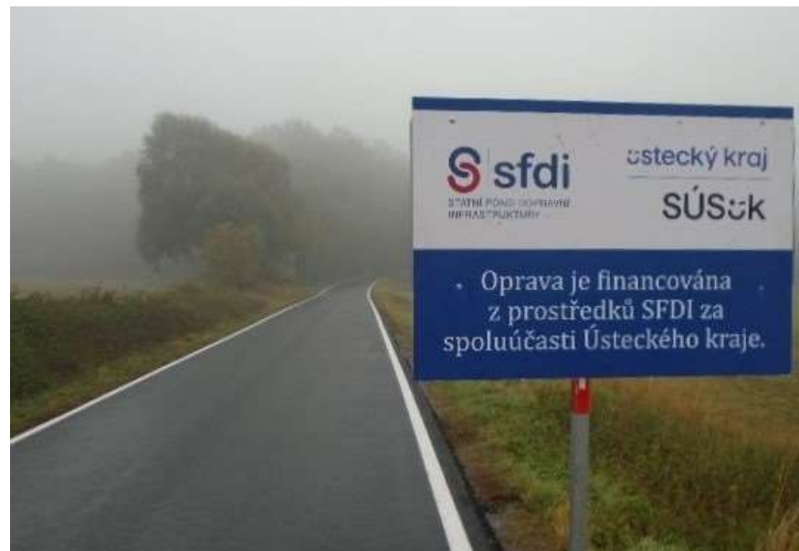
23. II/221 Hr. okr. Rakovník - V. Černoc