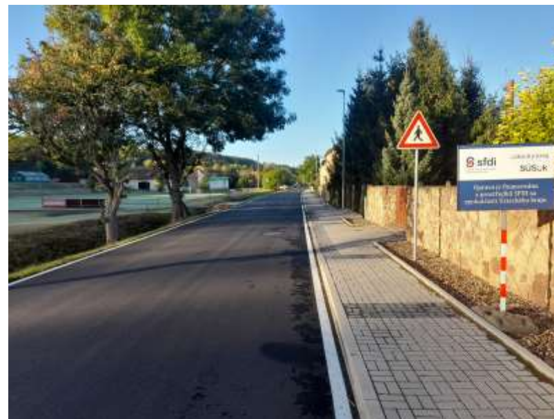
17. III/23741 Mšené lázně - Ředhošť