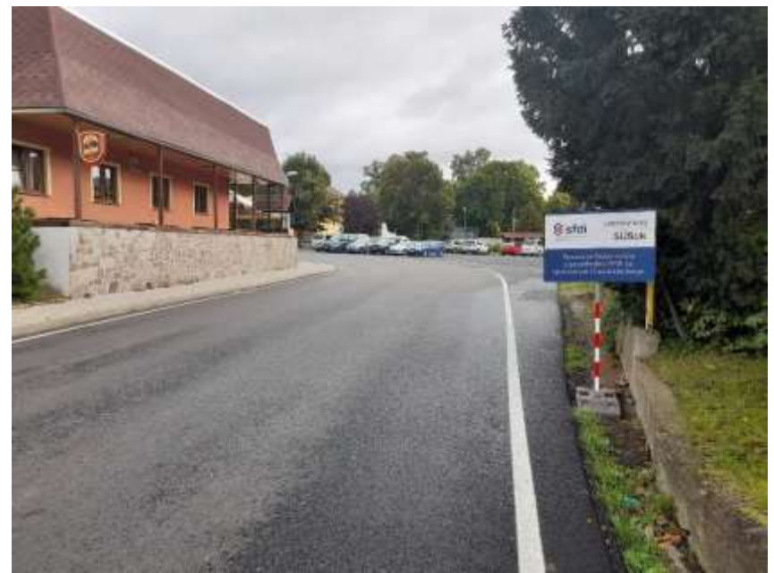
21. III/26015 Ploskovice