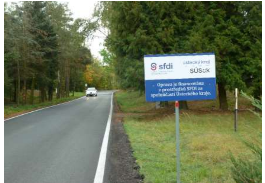
32. III/23737 Panenský Týnec - Vrbno nad Lesy