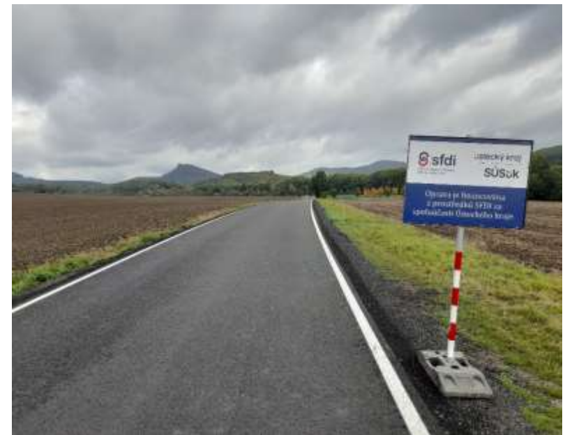
22. III/26015 Třebušín - Těchobuzice