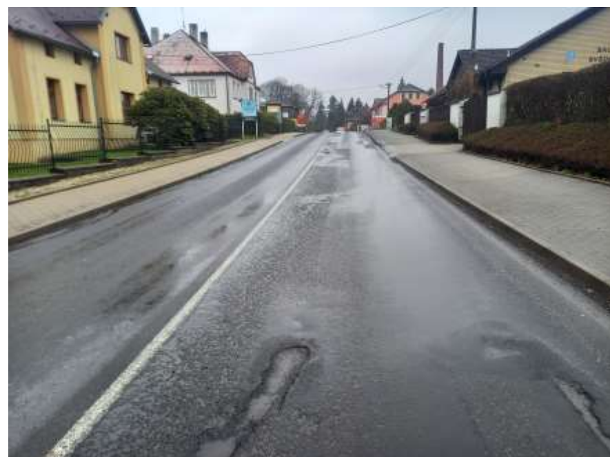
2. II/263 Rumburk průtah, ul. Pražská a Jiříkovská