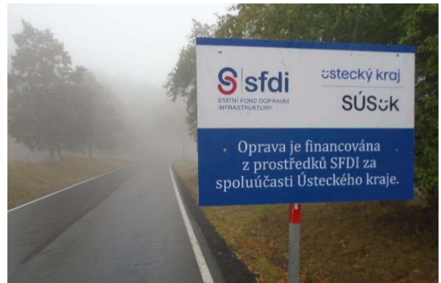
28. III/22711 Sádek