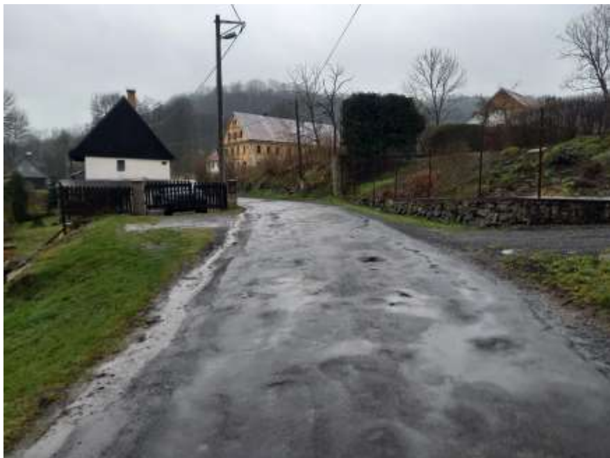
7. III/26222 Heřmanov - Blankartice