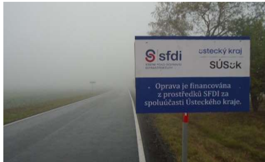
29. III/22712 křiž. s II/227 - směr Měcholupy