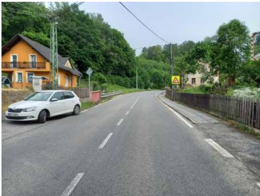
5. III/25854 Ludvíkovice – protismyková úprava