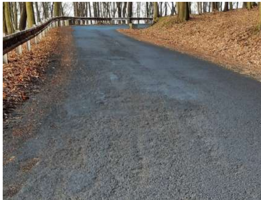
10. III/2543 Křižatky