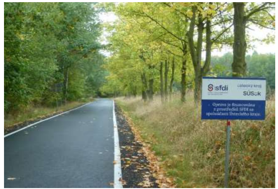
31. III/2292 Solopysky - směr Pnětluky