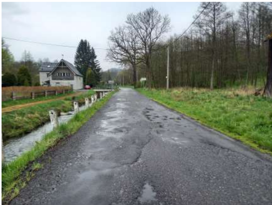
3. III/2639 Kerhartice - Veselé