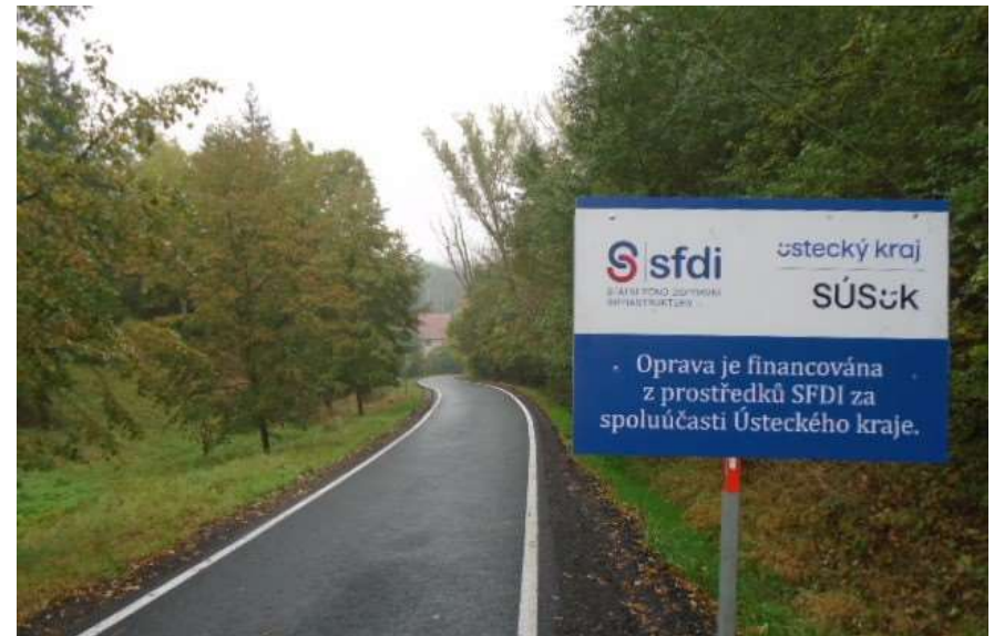
27. III/2514 Minice