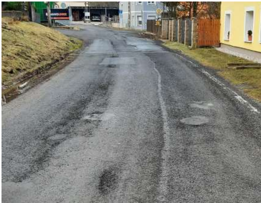
9. III/2545 Český Jiřetín