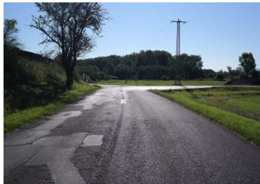
16. III/2474 Brňany - Bohušovice nad Ohří