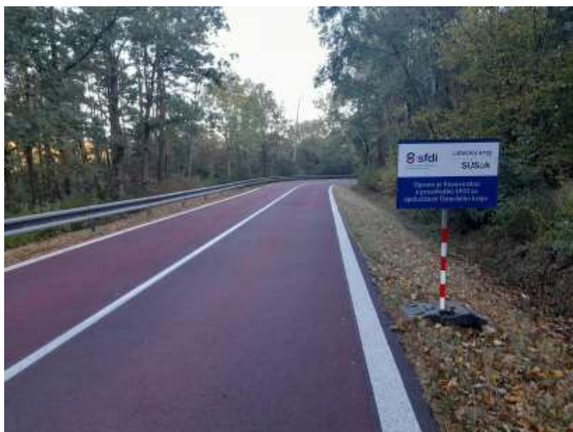
14. II/118 Mšené lázně – protismyková úprava