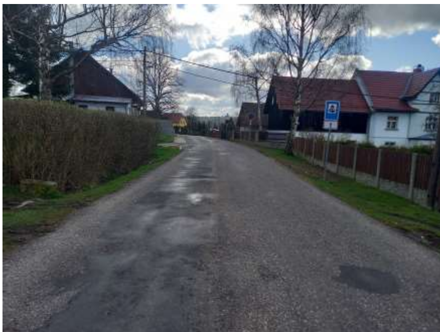
6. III/25856 Nová Oleška - Stará Oleška