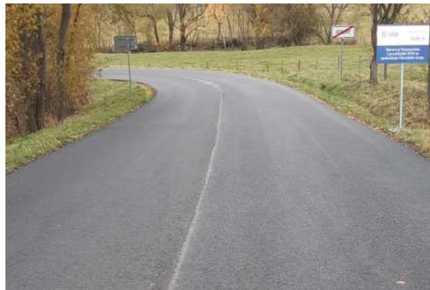
19. III/22316 Petlery - Alšovka (1.etapa)