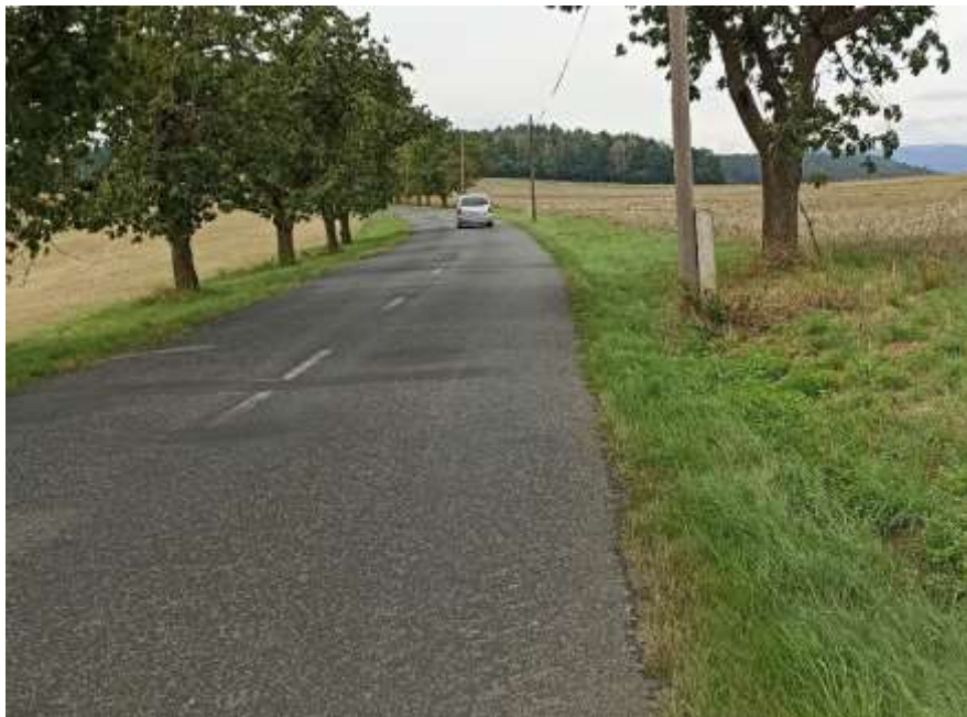
15. II/260 Ostré - hr. kraje