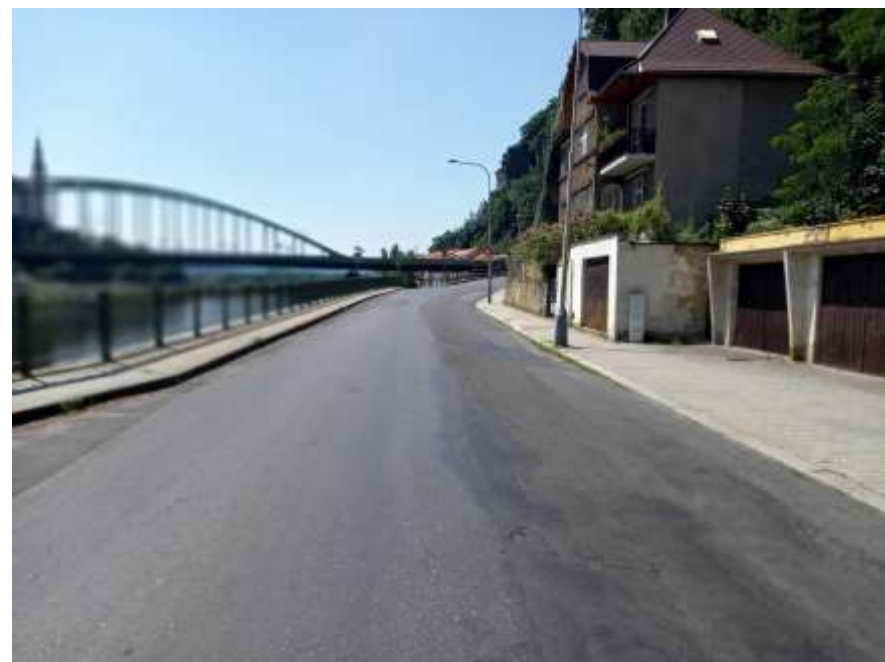
4. III/25852 Děčín - Přípeř