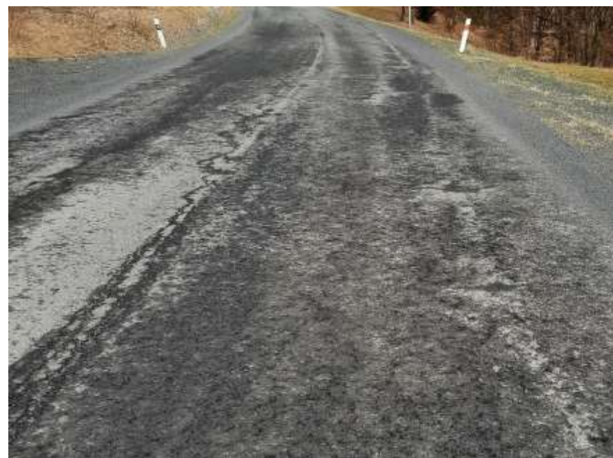
8. II/271 Klíny