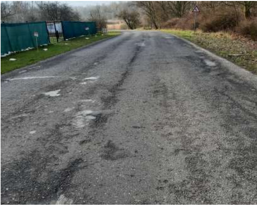
11. III/2564 Louka - Mariánské Radčice