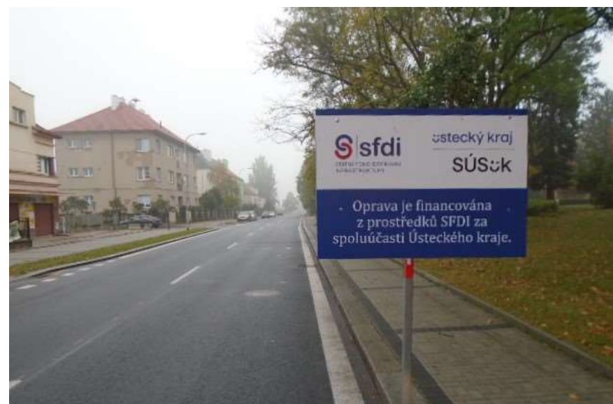
26. II/225 Žatec průtah (ul. Pražská) směr Louny