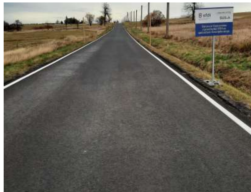
13. III /25220 Hr. okresu Chomutov - Malý Háj